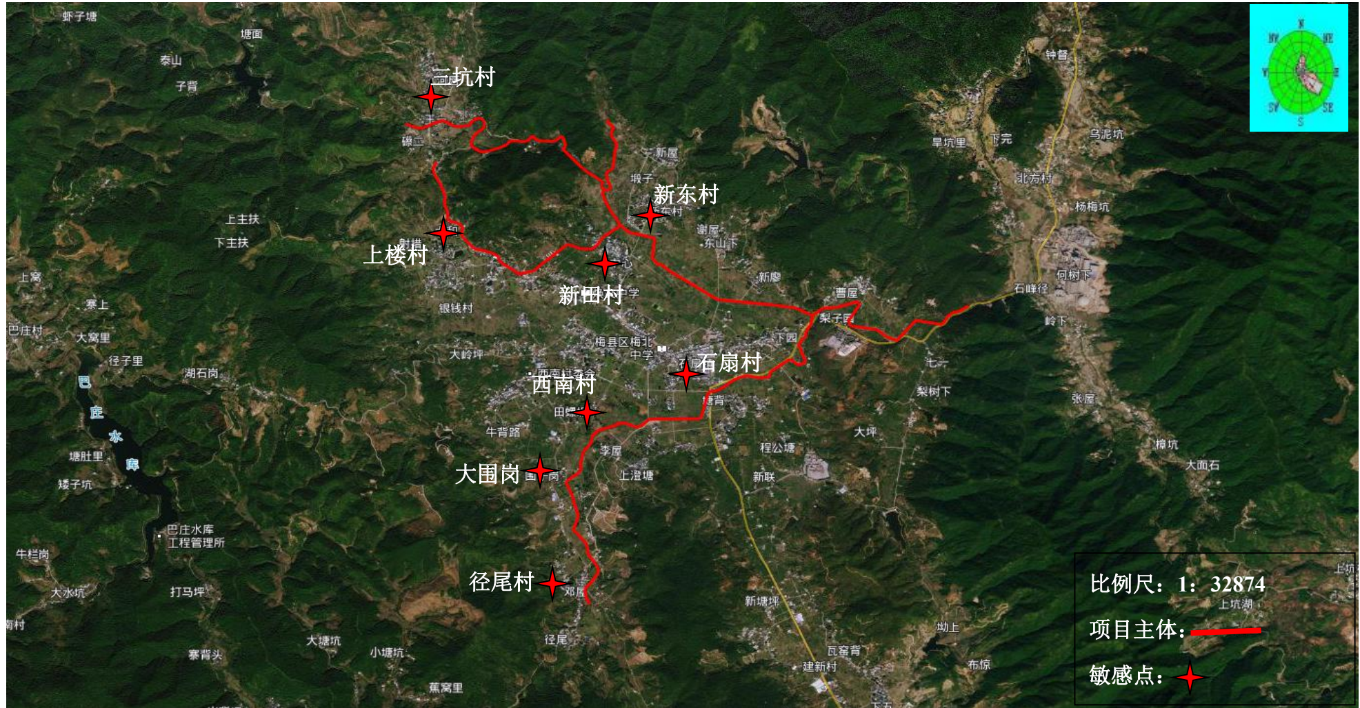
附图3 工程地理位置及敏感点图