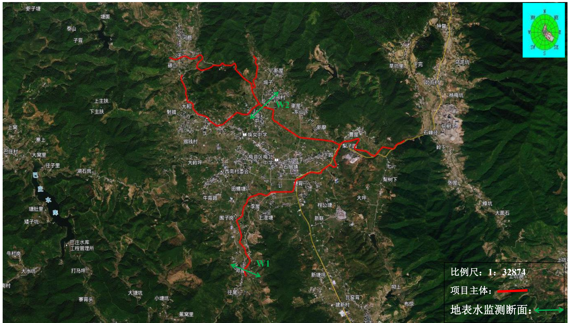
附图 1 工程地理位置图及监测点位图