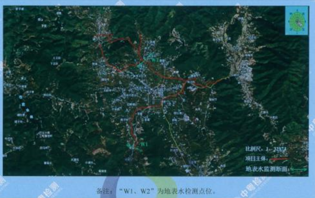
附图1 梅县区石扇河治理工程建设项目的地表水检测点位示意图