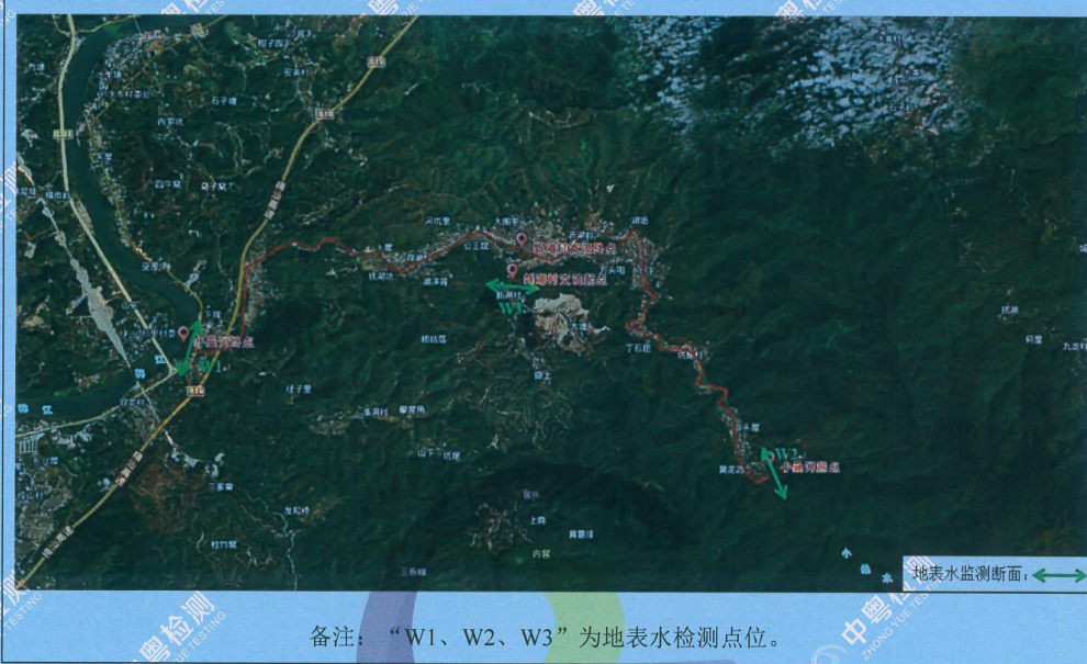
附图1 梅县区小桑水治理工程建设项目的地表水检测点位示意图