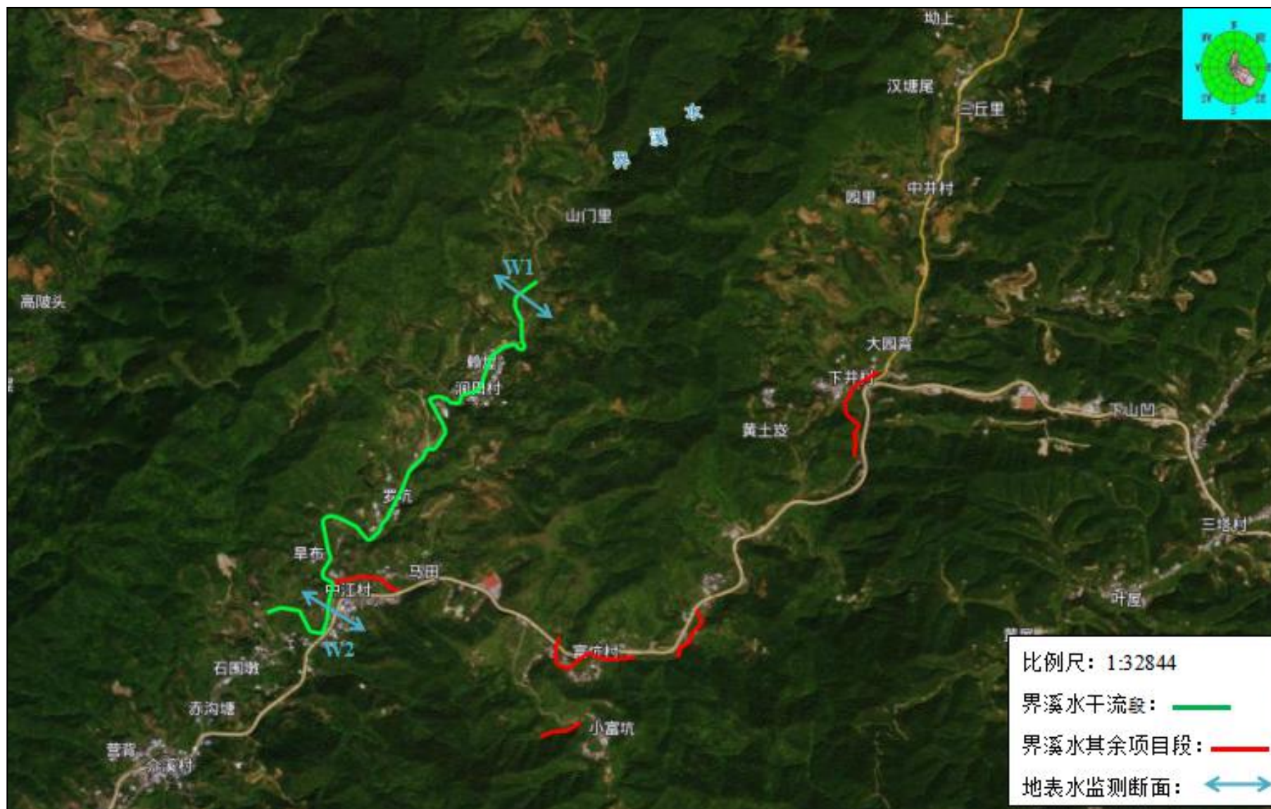
附图 1 工程地理位置图及监测点位图